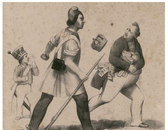
Caricature d'un républicain chassant le roi Louis-Philippe

A l'aide des documents ci-dessus, présentez les circonstances économiques et politiques qui ont conduit à la chute de Louis-Philippe en 1848.