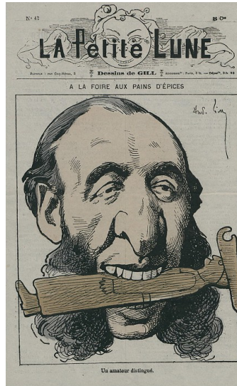
Gill, La Petite Lune, 1879

1881-1882 : lois Ferry rendant l'école obligatoire, gratuite et laïque entre 6 et 13 ans