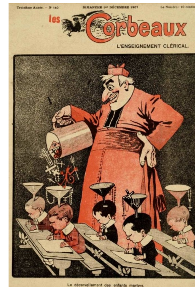
Le décerveau des enfants martyrs Les Corbeaux, 1 er décembre 1907

1904 : loi Combes interdisant aux congrégations religieuses le droit d'enseigner