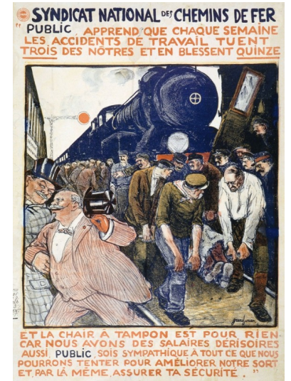
Affiche du syndicat national des chemins de fer, dessin de Jules Grandjouan, 1910

1884 : loi Waldeck-Rousseau autorisant les syndicats