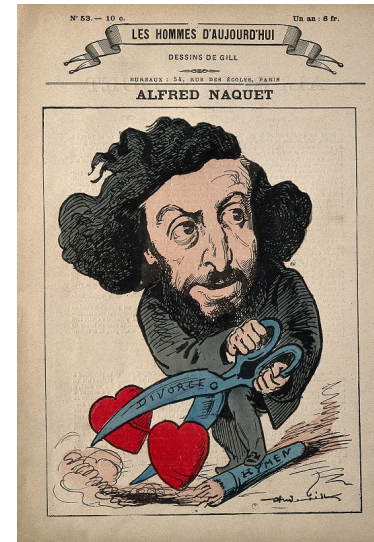
Les hommes d'aujourd'hui, Alfred Naquet, dessin de Gill, 1873

1904 : loi Combes interdisant aux congrégations religieuses le droit d'enseigner