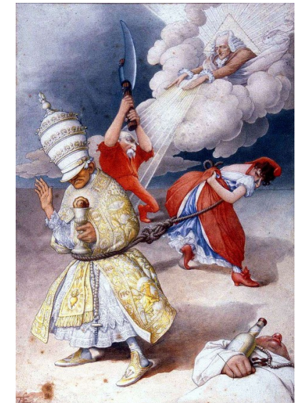
Combes séparant l'Église de l'État sous les auspices de Voltaire, gravure anonyme, 1904

1905 : loi Briand de séparation de l'Église et de l'État