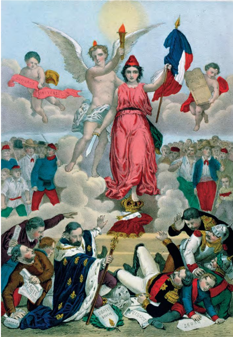
Le triomphe de la République, 1875, lithographie, Musée Carnavalet, Paris

1 - Dans quel contexte politique se déroule cette scène ?