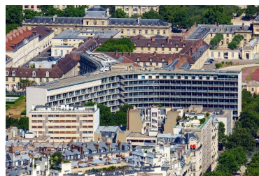
Palais de l'UNESCO