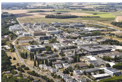
Plateau de Saclay