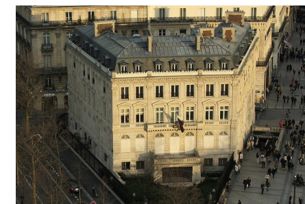
Ambassade du Qatar