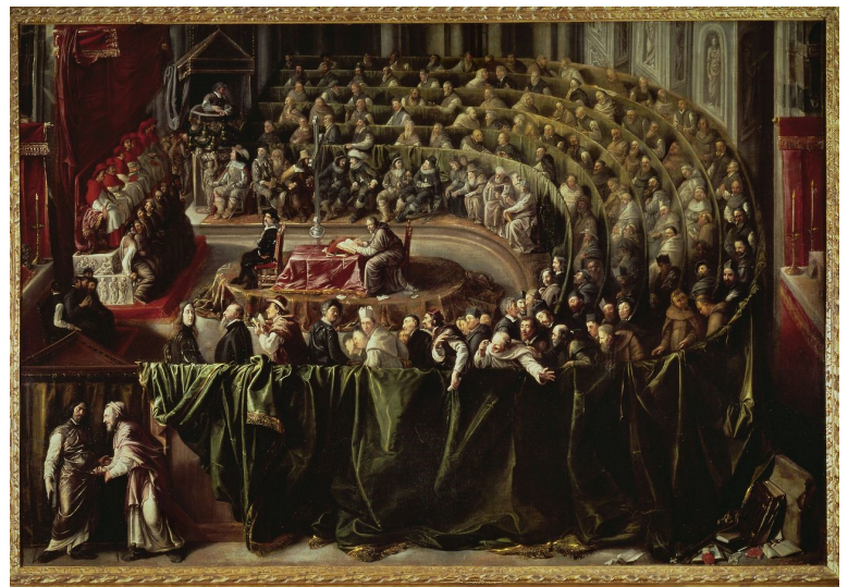
Procès de Galilée devant l'Inquisition en 1633, œuvre anonyme, coll. priv.

Lettre de Galilée adressée à Johannes Kepler, août 1597