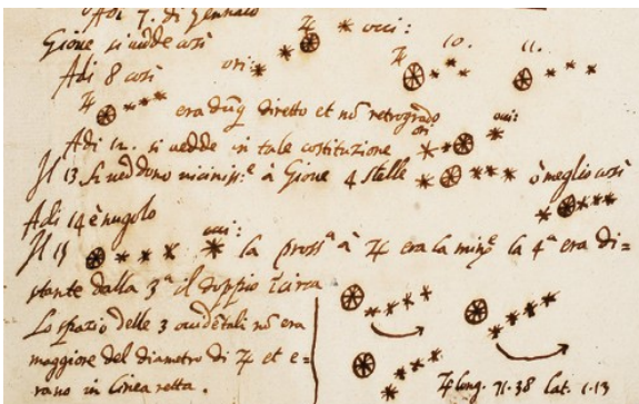
Notes et dessins sur les lunes de Jupiter, janvier 1610. Bibliothèque des collections spéciales de l'Université du Michigan