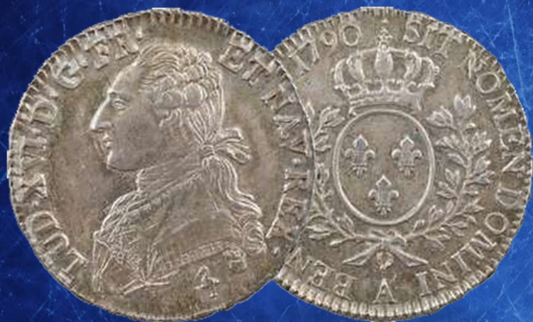
Pièce de monnaie d'un écu à l'effigie de Louis XVI

La fleur de lys, emblème de la Monarchie française est à l'origine une représentation stylisée de l'iris des marais ( Iris pseudacorum )