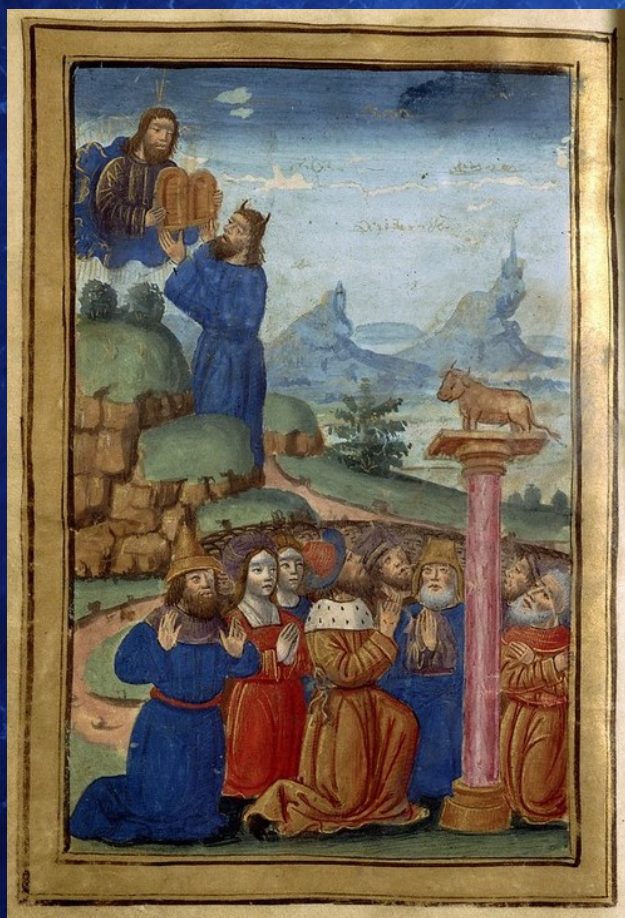
Atelier de Jean Bourdichon, Moïse recevant les Tables de la Loi et adoration du veau d'or, vers 1500, bibliothèque Sainte-Genève, Paris