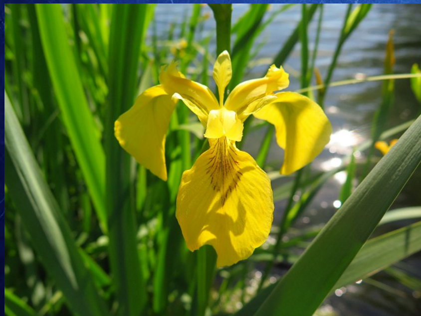
La fleur d'iris qui a inspiré la fleur de lys de la monarchie française