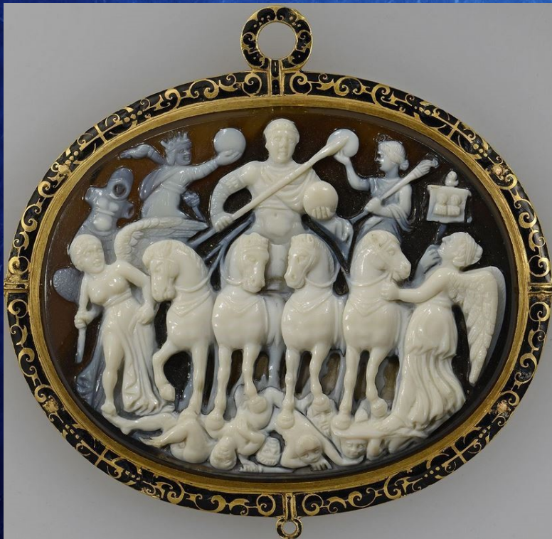
Camée, Le triomphe de Licinus , IV ème siècle, Département des monnaies, médailles et antiques, BnF, France