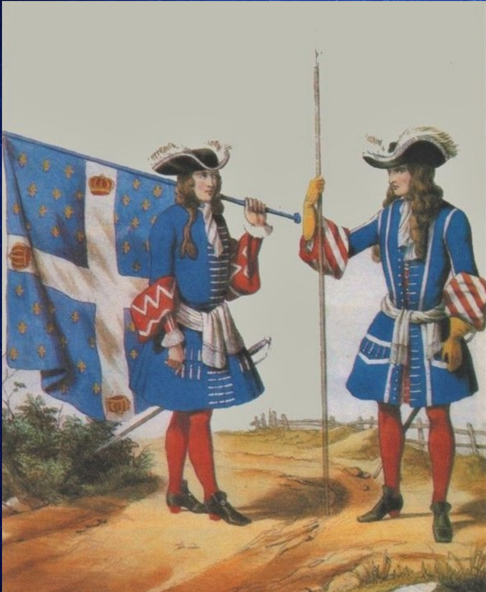
Uniforme du régiment des Gardes françaises créées à l'initiative de Catherine de Médicis en 1563 pour assurer la garde du roi