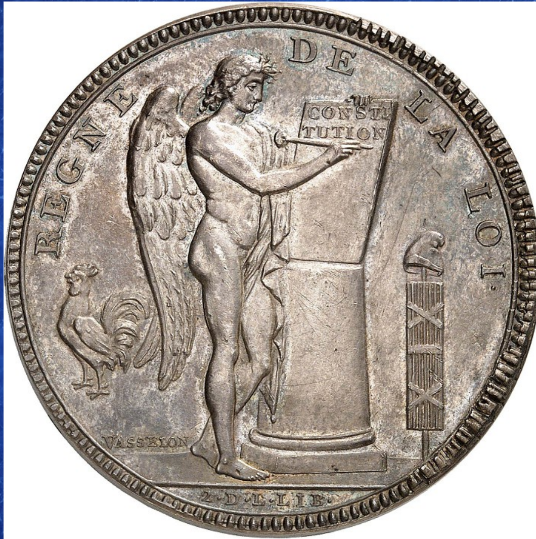
Avers d'un écu constitutionnel de 1791 représentant la figure du coq à gauche du génie inscrivant la constitution, essai en argent par Vasselon