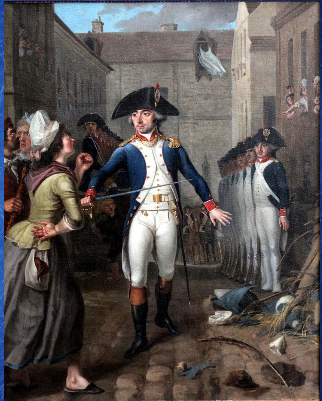
Uniforme de la Garde nationale de Paris créée en 1789 et placée par le roi sous le commandement du marquis de La Fayette