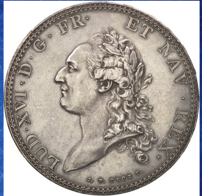
Louis XVI lauré, écu de Calonne en argent, 1786, atelier de Paris