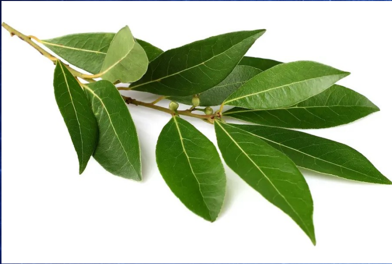
Laurus nobilis, ou laurier-sauce