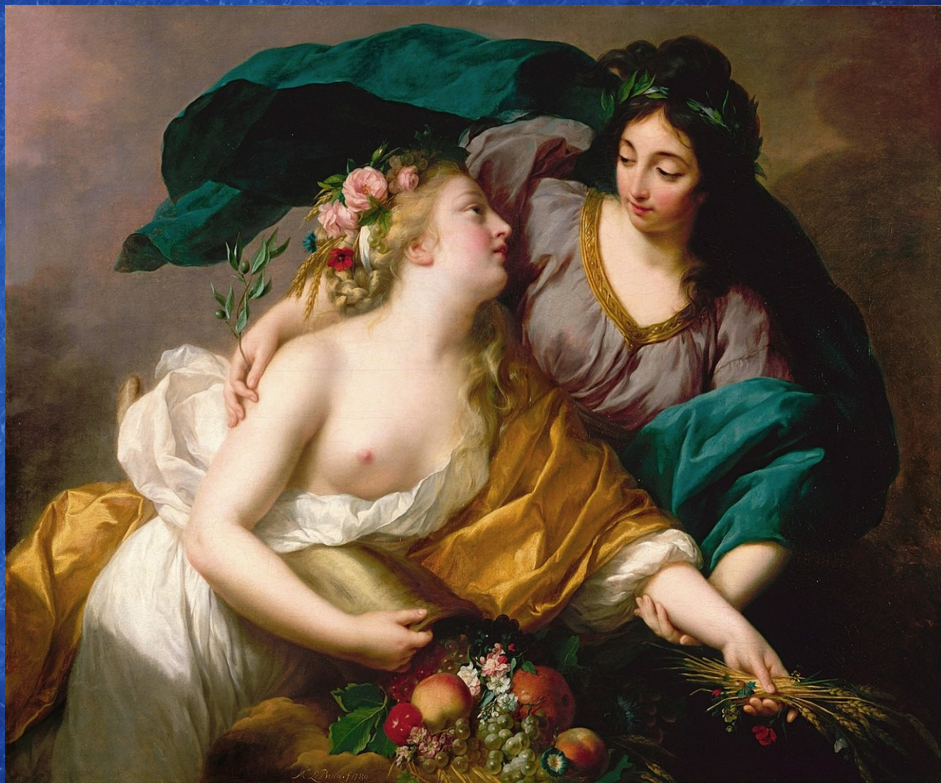
Élisabeth Louise Vigée Le Brun, La Paix ramenant l'Abondance , 1750, musée du Louvre, Paris