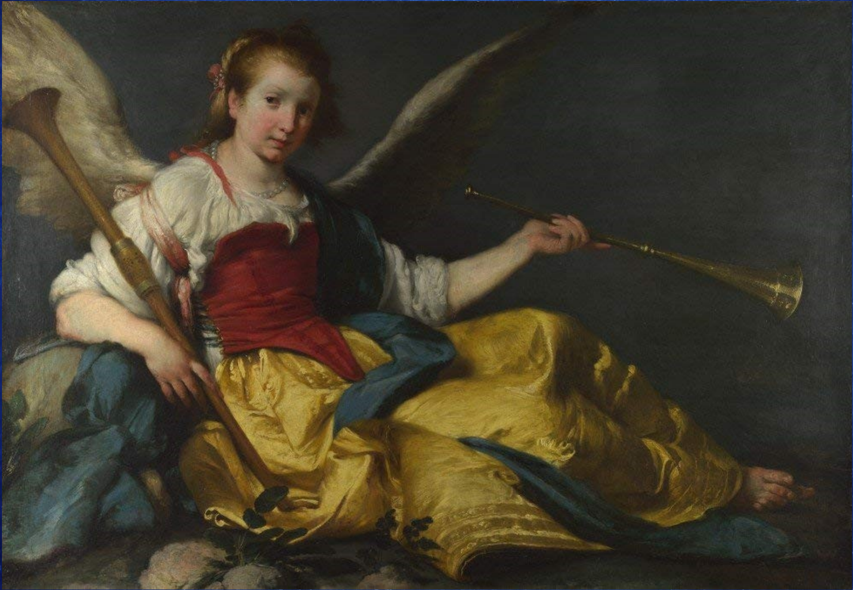
Allégorie de la Renommée, Bernardo Strozzi, XVII ème siècle, National Gallery, Londres