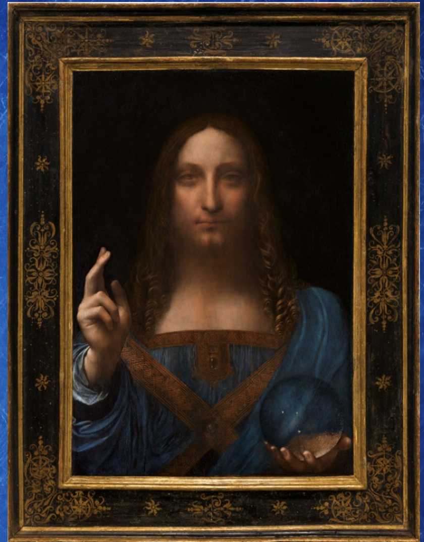
Une autre célèbre représentation du globe dans la main gauche du Christ, le Salvator Mundi , peinture attribuée par certains experts à Léonard de Vinci, vers 1500, collection privée du prince héritier d'Arabie saoudite Mohammed ben Salmane