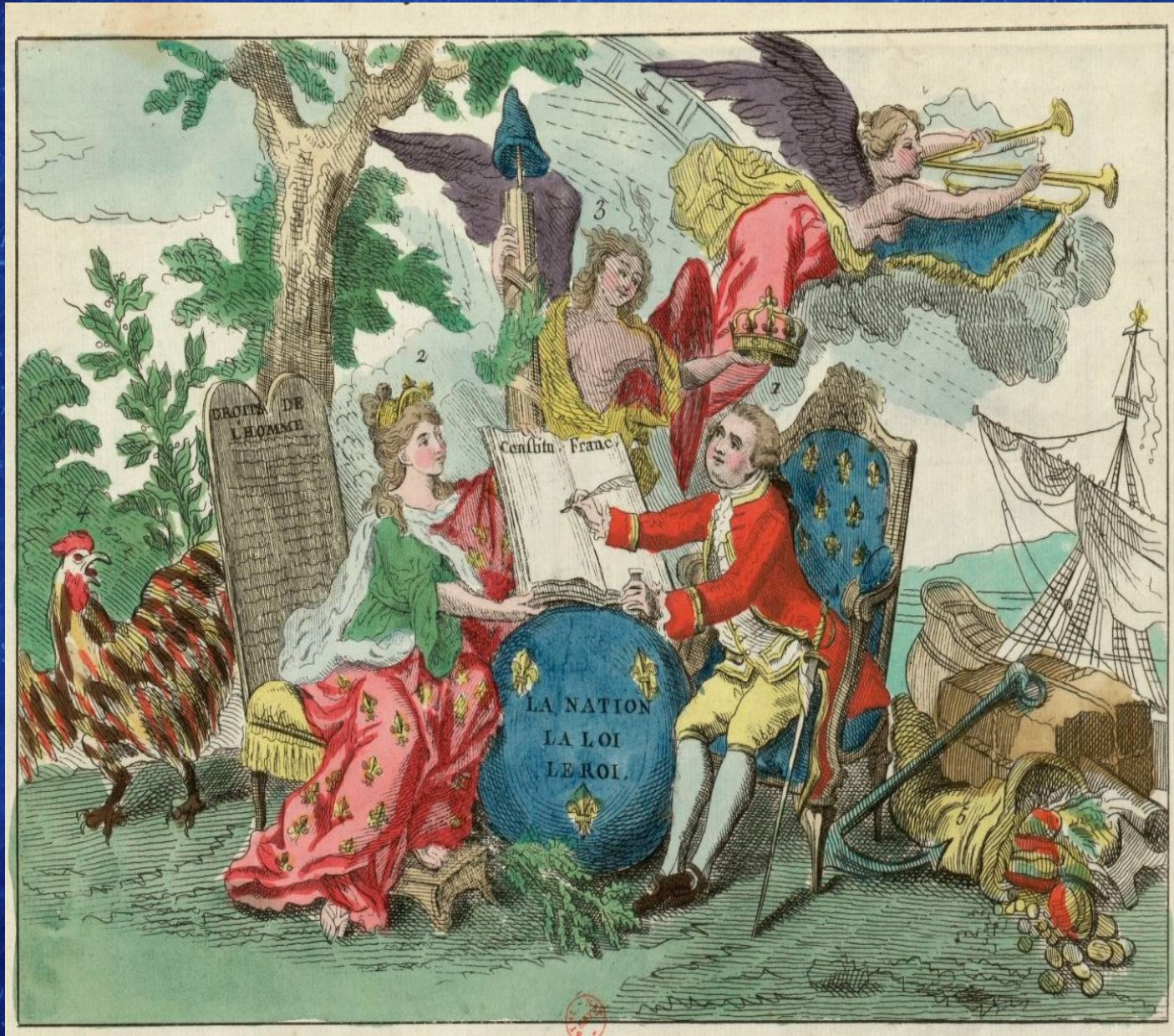
Louis XVI signe la Constitution... Estampe, eau-forte, graveur anonyme, 1791. Imprimé chez Jacques Simon Chereau l'Aîné, Aux Deux Colonnes, rue Saint Jacques n° 257, musée Carnavalet, Paris