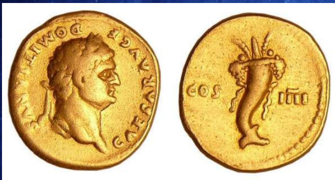
Aureus de Domitien 1 er siècle après J-C.