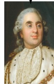
Guerre Américaine 1778-1783 Convocation des États-Généraux 5 mai 1789