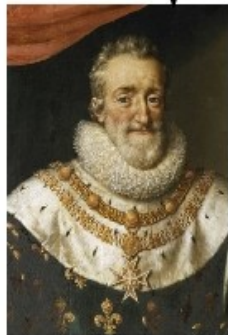
Conversion au catholicisme en 1593 Édit de Nantes en 1598 Assassinat en 1610