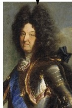
Écrasement de la Fronde en 1653 Révocation de l'Édit de Nantes en 1685 Mazarin (1643-1661) puis Colbert (1661-1683) Installation de la Cour à Versailles en 1682