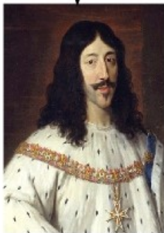
1 er ministre : cardinal de Richelieu