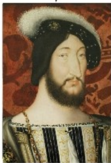
Échec à devenir empereur en 1519 Ordonnance de Villers-Cotterêts 1539