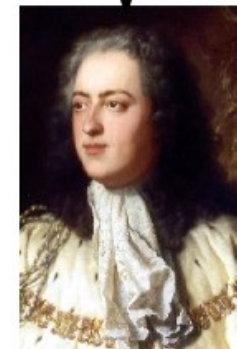
Guerre de 7 ans : Nouvelle-France et Louisiane perdues en 1763 Tentative d'assassinat en 1757