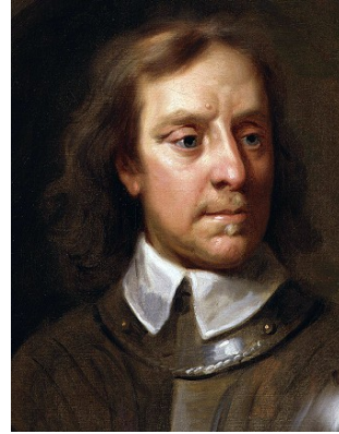
Oliver Cromwell par Samuel Cooper

Le roi Charles I er cherche à instaurer une monarchie absolue sur le modèle français. L'Angleterre entre alors dans une période de guerre civile entre les partisans du roi et les parlementaires (1641-1649). Les parlementaires victorieux condamnent Charles I er à mort pour haute trahison. Il est décapité en 1649.