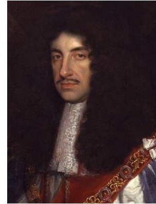
Charles II d'Angleterre par John Michael Wright

Dès lors, le chef des parlementaires, Oliver Cromwell s'empare du pouvoir et instaure une République qui tourne aussitôt à la dictature personnelle. Après sa mort en 1658, son fils Richard Cromwell lui succède pendant deux ans avant d'être lui-même chassé du pouvoir par les monarchistes.