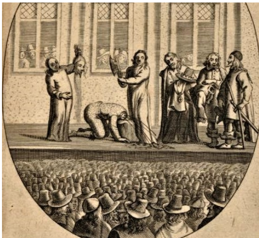
L'exécution de Charles I er , gravure de Peeter Huybrechts, 1649

En 1685, à la mort de Charles II, son frère Jacques II lui succède et reprend les arrestations arbitraires ce qui conduit à une seconde révolution (la Glorieuse Révolution : 1688-1689). Le Parlement produit alors un second texte en 1689 : la Déclaration des Droits ( Bill of Rights ) qui limite définitivement les pouvoirs du roi au profit du Parlement. Les principales libertés y sont reconnues et le Parlement reçoit l'essentiel des pouvoirs en matière de lois, d'impôts et de guerre.