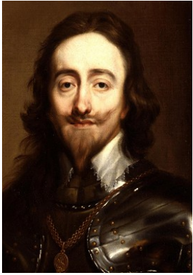
Charles I er d'Angleterre, Par Antoine van Dyck

Le roi Charles I er cherche à instaurer une monarchie absolue sur le modèle français. L'Angleterre entre alors dans une période de guerre civile entre les partisans du roi et les parlementaires (1641-1649). Les parlementaires victorieux condamnent Charles I er à mort pour haute trahison. Il est décapité en 1649.