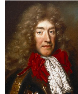
Jacques II d'Angleterre par Nicolas de Largillière

Le nouveau roi Charles II (fils de Charles I er ) essaye à son tour d'instaurer une monarchie absolue mais en vain. Finalement, le Parlement parvient à lui imposer en 1679 un texte qui limite ses pouvoirs, c'est l' Habeas corpus qui interdit au roi tout emprisonnement arbitraire et qui fixe les droits des justiciables.