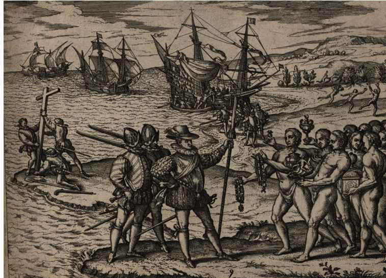
L'arrivée de Christophe Colomb à San Salvador, gravure de Théodore de Bry, Americae Tertia Pars 4, 1594, BnF