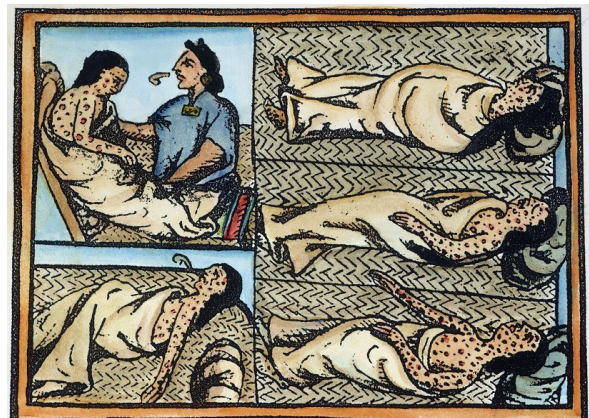
Indiens malades de la variole, dessin anonyme collecté par Bernardino de Sahagún, Histoire générale des choses de la Nouvelle Espagne , 1570, Bibliothèque Laurentienne, Florence

Sahagún, Histoire générale de la Nouvelle-Espagne , milieu du XV ème siècle