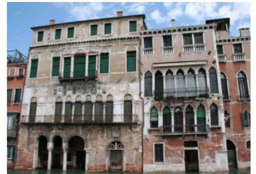
La Ca d'Oro, une demeure construite au XV e siècle par un riche marchand vénitien. Sa façade de marbre était à l'époque recouverte de 23 000 feuilles d'or

D'après Philippe de Commines, Mémoires , 1461-1498