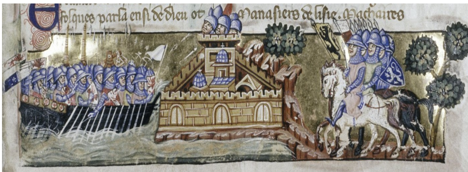
Constantinople assiégée en 1204 par les Vénitiens côté mer et par les Croisés côté terre, miniature de La conquête de Constantinople , Geoffroy de Villehardouin, vers 1330