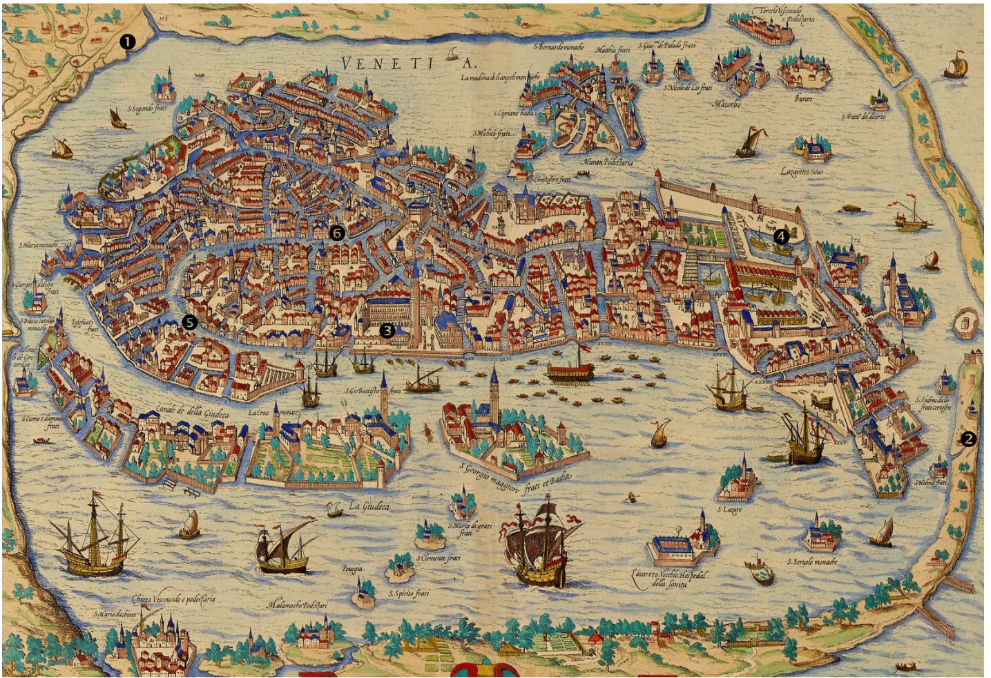
Gravure du XVI e siècle, Bibliothèque universitaire de Salamanque