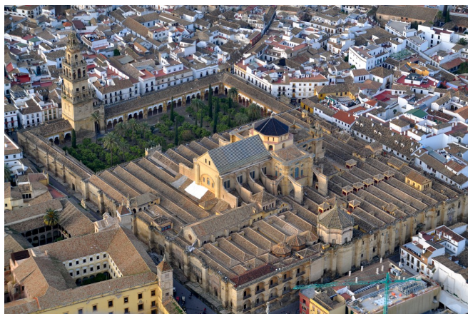
Mosquée-cathédrale de Cordoue aujourd'hui