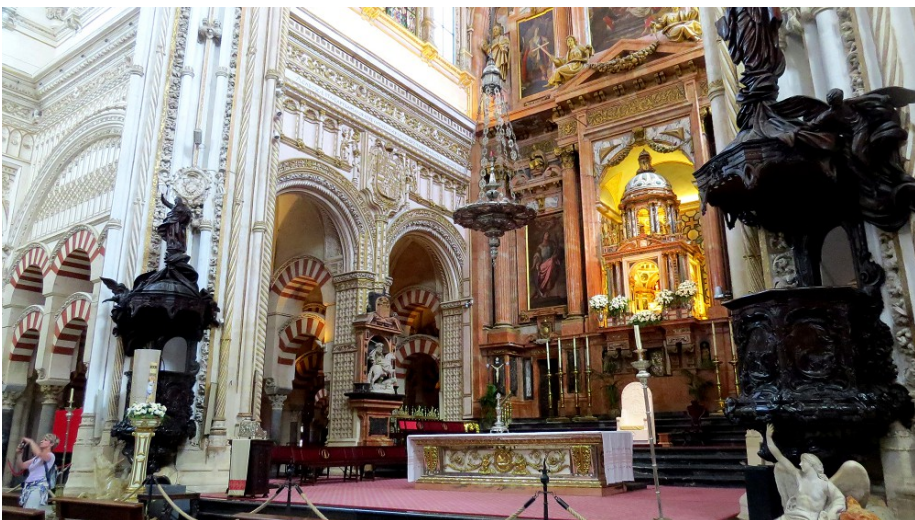
Intérieur de la cathédrale de Cordoue