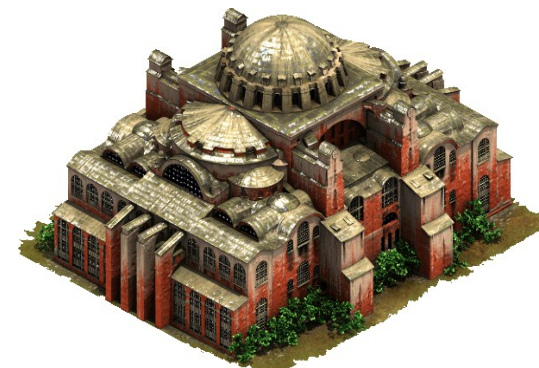
Basilique Sainte-Sophie avant 1453