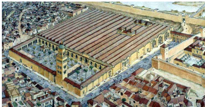
Mosquée de Cordoue à l'époque musulmane