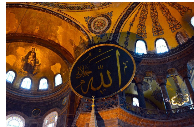
Vue intérieure de Sainte-Sophie

Montrez dans un paragraphe argumenté que la mosquée de Cordoue et la basilique Saint-Sophie sont des monuments emblématiques du syncrétisme culturel qui s'est opéré dans le bassin méditerranéen et qu'ils ont toute leur place dans le classement au patrimoine mondial de l'Humanité réalisé par l'UNESCO.