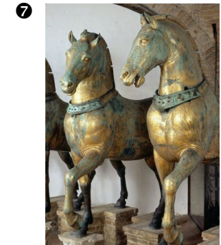
Chevaux de l'hippodrome de Byzance rapportés par les Croisés au moment du sac de Constantinople en 1204

8 En l'année du seigneur 1348, sévit sur presque toute la surface du globe une telle mortalité, qu'on en a bien rarement connu de semblable. Les vivants en effet pouvaient peine suffire à enterrer les morts, ou l'évitaient avec horreur. Une terreur si grande s'était emparée de presque tout le monde, qu'à peine un ulcère ou une grosseur apparaissait-elle chez quelqu'un, généralement sous l'aine ou sous l'aisselle, la victime était privée de toute assistance, parfois même abandonnée de parent. Le père laissait le fils sur son grabat, et le fils son père. [...] Beaucoup encore, saisis par ce mal et qu'on croyait destinés à coup sûr à en mourir sur le champ, étaient transportés à la fosse pour être inhumés : aussi un grand nombre furent-ils enterrés vivants.