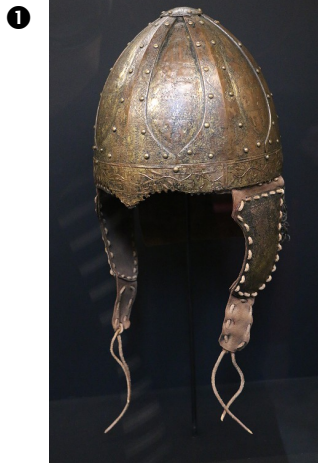
Casque de combat franc de Vezeronce, VI ème siècle

Rattachez chacun des documents ci-dessous à l'événement fondateur ou marquant de la civilisation qui lui revient Méthodologie : identifiez la nature de chacun de ces documents