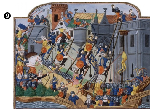
Chroniques de Charles VII, roi de France, de Jean Chartier, milieu XV ème siècle

Vitae paparum Avenionensium Clementis prima vita, XIV ème siècle