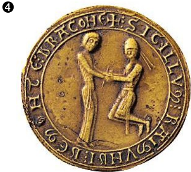
Sceau de Raymond de Mondragon, XIII ème siècle, BnF