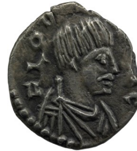
Monnaies : Romulus Augustule à gauche, Odoacre à droite

3 « Il s'avance, nouveau Constantin, vers la piscine, pour effacer la maladie d'une vieille lèpre et pour effacer avec une eau fraîche les sordides taches anciennement acquises. Lorsqu'il fut entré pour le baptême, le saint de Dieu l'interpella d'une voix éloquente en ces termes : « Dépose humblement tes colliers, ô Sicambre, adore ce que tu as brûlé, brûle ce que tu as adoré ». [...] Ainsi donc, le roi, ayant confessé le Dieu tout puissant dans sa Trinité, fut baptisé au nom du Père et du Fils et du Saint-Esprit et oint du saint chrême avec le signe de la croix du Christ. Plus de trois mille hommes de son armée furent également baptisés. »