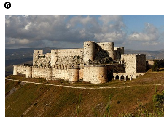
Krak des chevaliers, Syrie