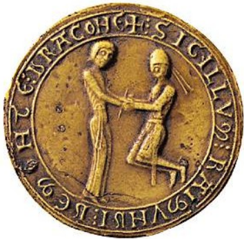
Sceau de Raymond de Mondragon, XIII ème siècle, BnF