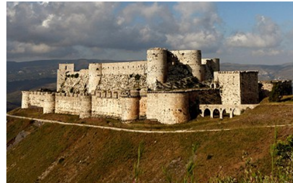
Krak des chevaliers, Syrie