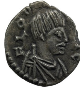
Monnaies : Romulus Augustule à gauche, Odoacre à droite