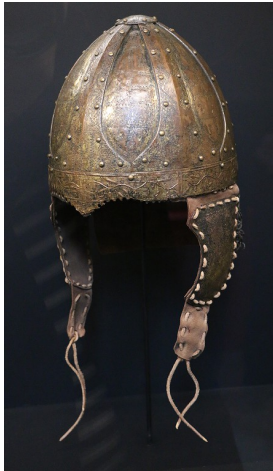
Casque de combat franc de Vezeronce, VI ème siècle