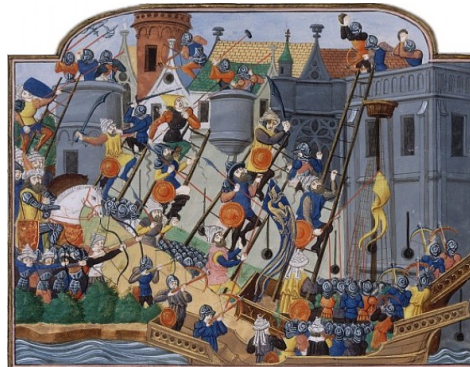
Chroniques de Charles VII, roi de France, de Jean Chartier, milieu XV ème siècle