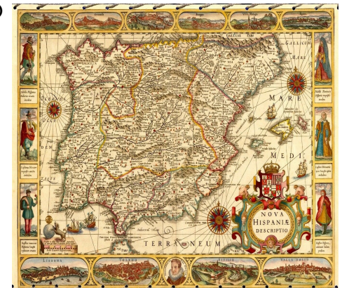
Carte de l'Espagne en 1592