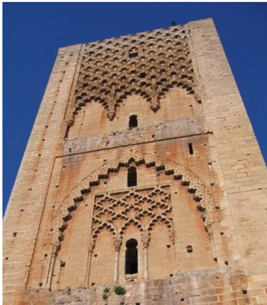
Sebkas sur la tour Hassan, XII ème siècle, Rabat, Maroc