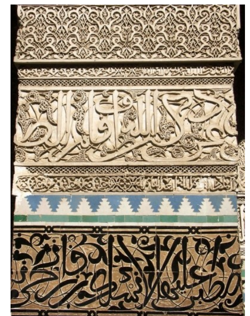
Arabesques, motifs géométriques et calligraphie, Médersa el-attarine, XIV ème siècle, Fès, Maroc