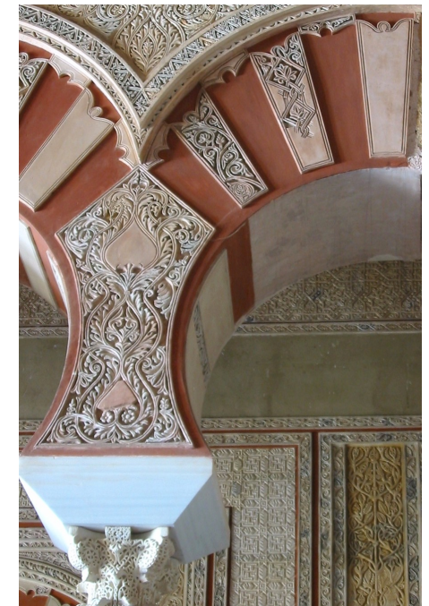
Arcs outrepassés, Madinat al-Zahra, X ème -XI ème siècle, Andalousie