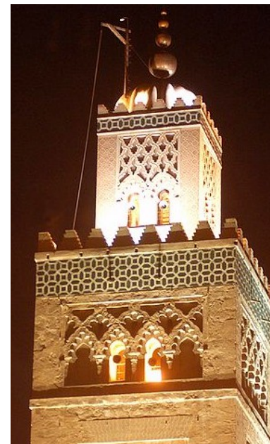
Mosquée de la Koutoubia, XII ème siècle, Marrakech, Maroc