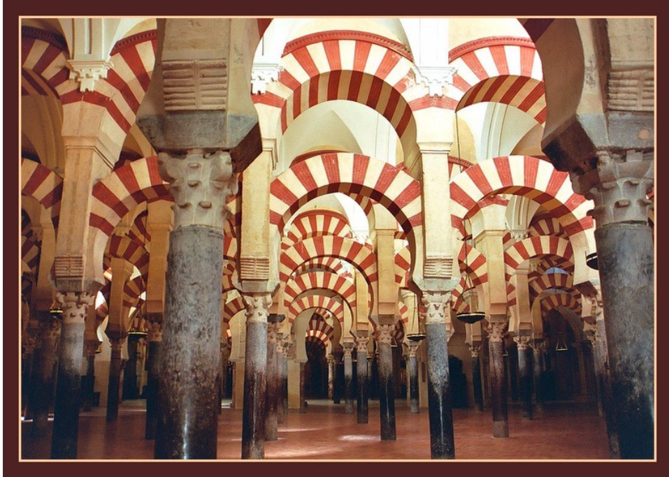
Arcs superposés, mosquée de Cordoue, VIII ème -X ème siècles, Andalousie