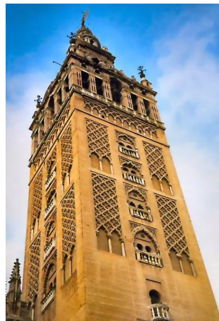
Giralda, fin XII ème siècle, Séville, Espagne