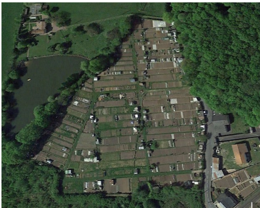
Le jardin familial Maurice-Laurentin, rue de la Tuilerie