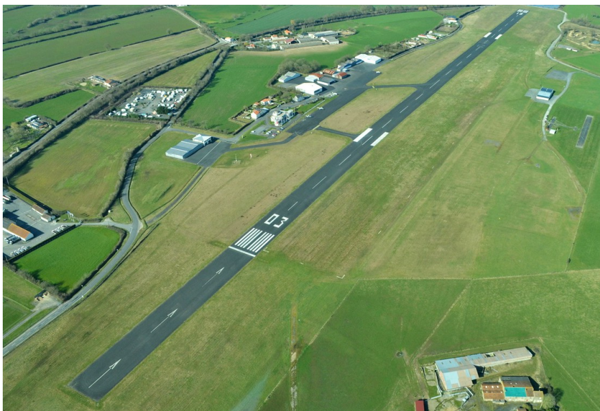
Aérodrome Cholet le Pontreau