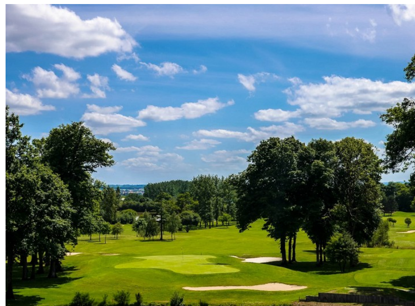
Le golf du Chêne Landry