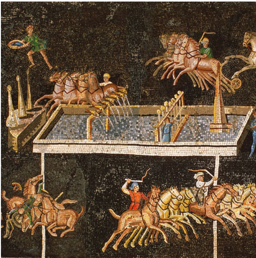
Course de quadriges dans le cirque. Les conducteurs sont répartis en quatre équipes identifiées par des couleurs : rouge, blanc, bleu et vert. Mosaïque, 5x3m, fin du II ème siècle, Lyon, musée gallo-romain de Fourvière.

En vous aidant des l'ensemble des documents de ce dossier, repérez ci-dessus l'emplacement des constructions attestant de la très forte romanisation de Lugdunum au début de l'Empire.