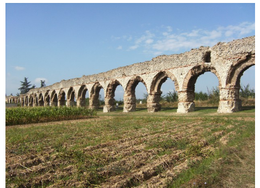
L'aqueduc du Gier