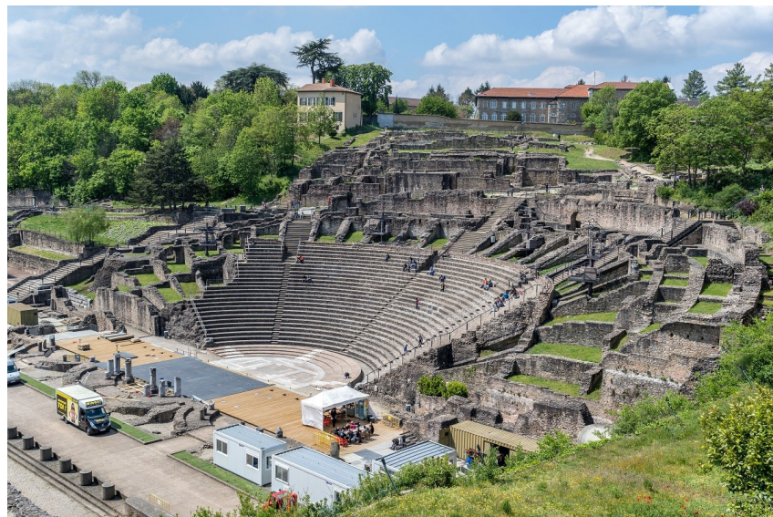
Le théâtre de Fourvière