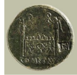
Sesterce de bronze représentant l'autel des trois Gaules sous Auguste