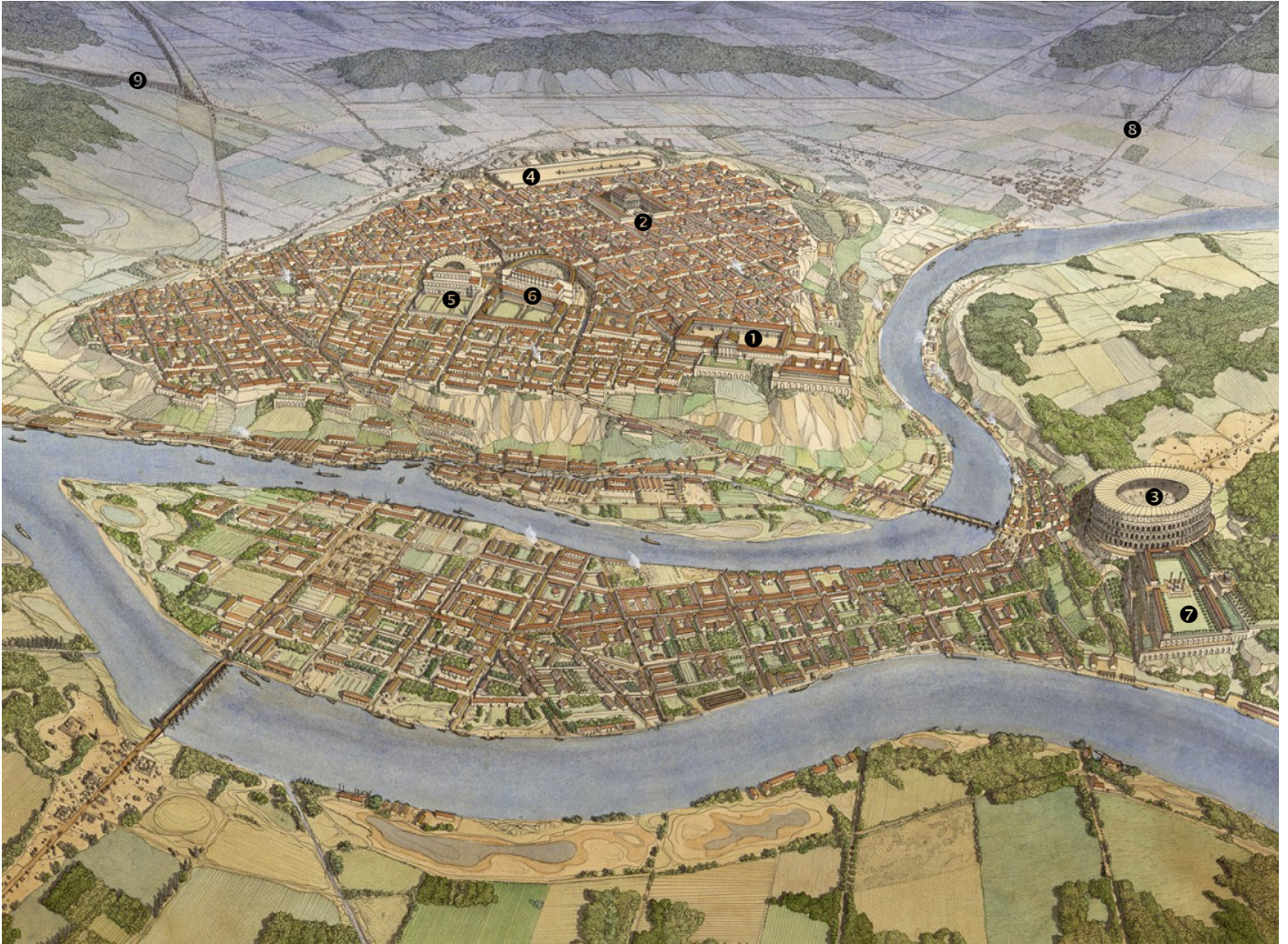
Vue d'artiste, Lugdunum sous l'Empire romain