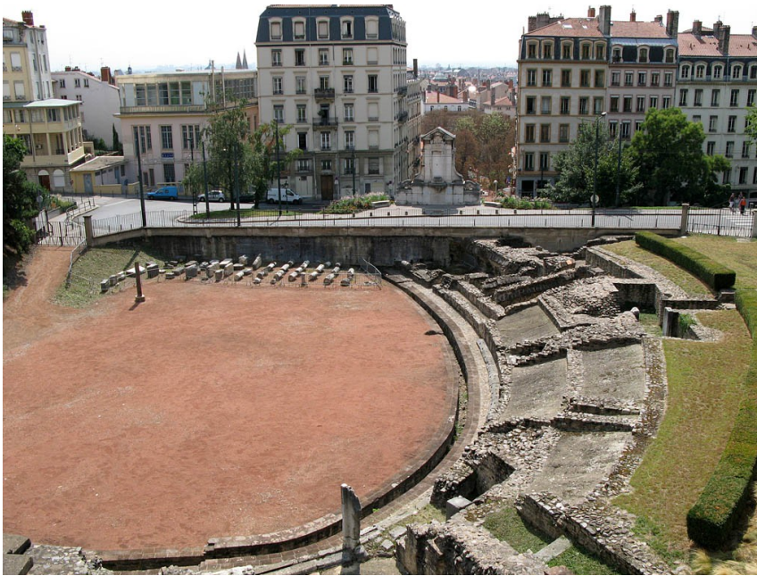
Vestiges de l'amphithéâtre des trois Gaules

« C'est la ville de Gaule la mieux peuplée après Narbonne ; elle se distingue par son commerce [...]. Devant cette ville, à l'endroit où la Saône se joint au Rhône, est construit le temple que tous les Gaulois en commun ont dédié à Auguste. On y voit un autel magnifique, sur lequel sont gravés les noms des soixante peuples, représentés par autant de statues. Cet autel est de hauteur considérable.»