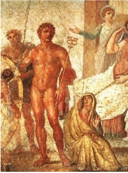
Casa Vetti, Pompéi