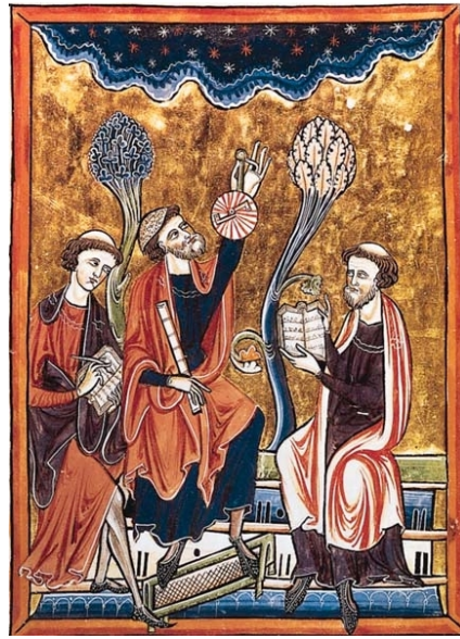
Psautier de Saint-Louis, manuscrit enluminé, Paris, BNF