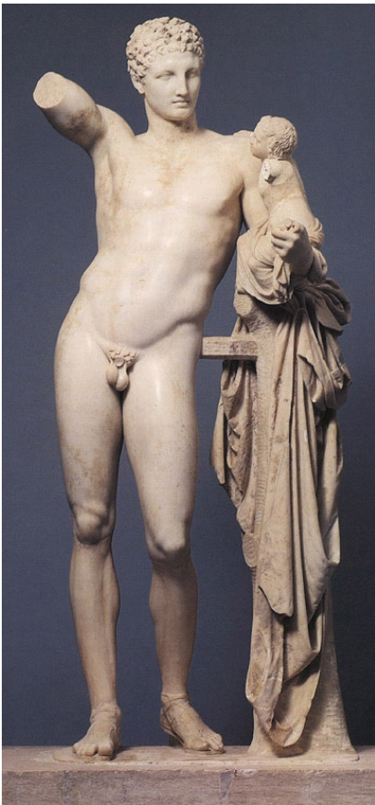
Hermès portant Dionysos, Praxitèle, Olympie, V ème siècle av. J-C.