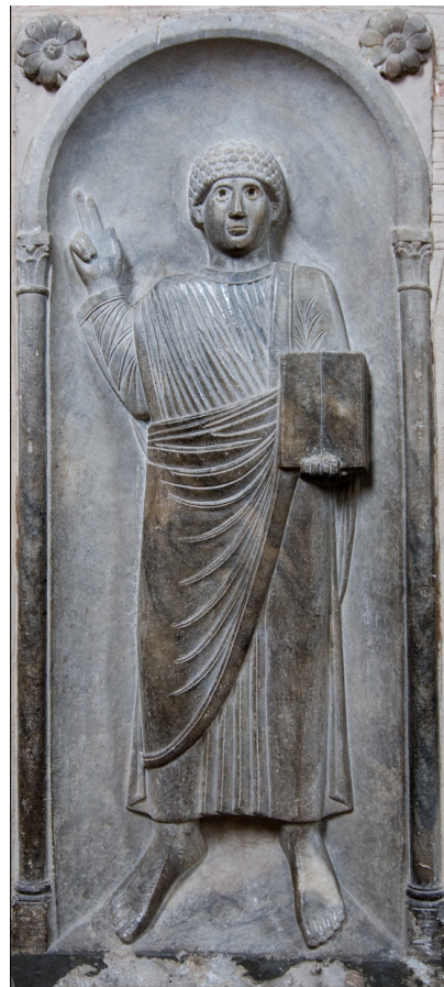
L'apôtre, Basilique Saint-Sernin, Toulouse, XI ème siècle